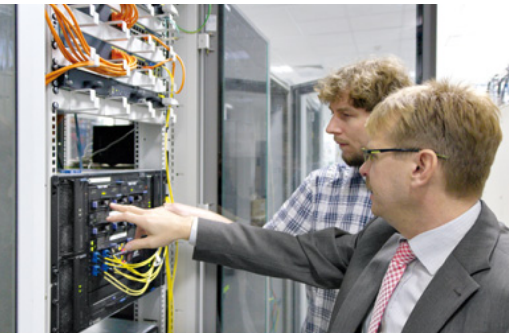
Eine zeitgemäße IP-Sprachvermittlung muss als Multiprotokoll-Plattform sowohl die klassischen TDM-Anschaltungen und -Protokolle als auch alle gängigen VoIP-Protokolle abdecken; der Cirpack Softswitch ist eine modulare Class-4/5-Lösung, die auf einer IMS-/Tispan-Architektur aufbaut

Der Zeitplan für die Softswitch-Einführung war sehr ambitioniert. Nach der Entscheidung blieben nur vier Mo-